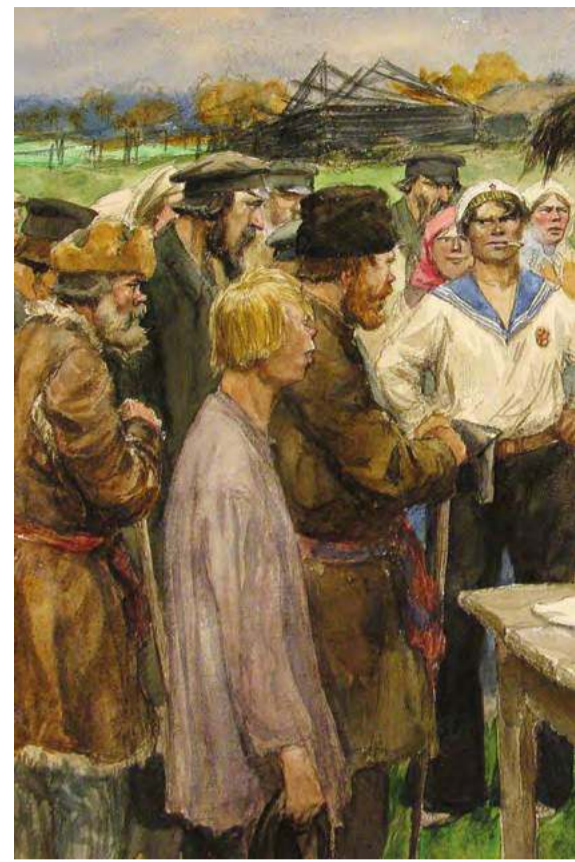
Иван Владимиров. «Агитатор». Год неизвестен

Одним из необычных способов борьбы с изъятием хлеба у крестьян еще до введения непосильной продразверстки стало массовое производство самогона в больших количествах. С одной сторо-