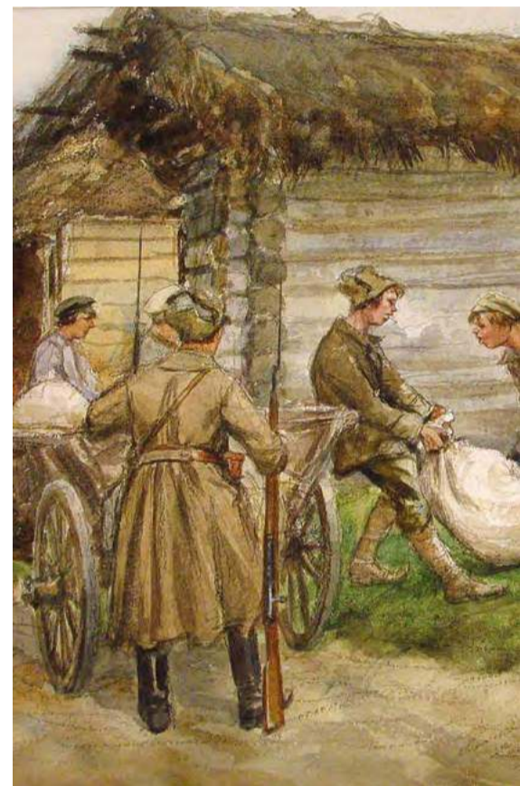
Иван Владимиров. «Продразверстка (реквизиция)». Год

ны, он лучше продавался в городах, и его транспортировка занимала меньше места в телегах и санях. С другой — в деревнях считали, что лучше хлеб перегнать на самогон, чем бесплатно отдать в разверстку. Власть усиленно боролась с этим процессом, но не всегда успешно.