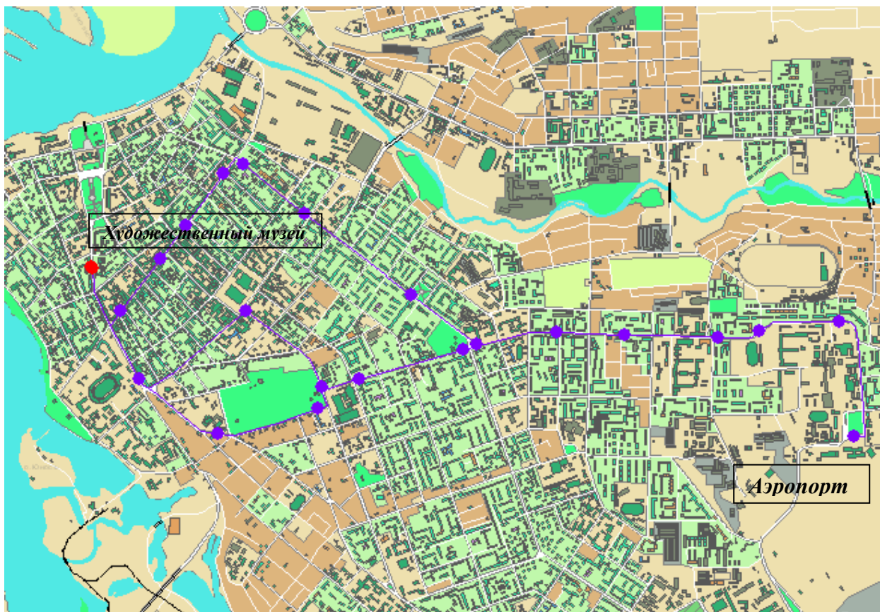
Схема проезда от Аэропорта до ИГУ (корпус №3, ул. Ленина, 3) Остановка транспорта «Художественный музей» Маршрутные такси / автобусы: 3, 20, 80, 480, 42, 43; троллейбус: 4